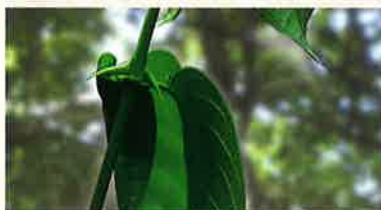
ペルーのジャングルに自生する「キャッツクロー」

ヤマノでは毎日お身体に摂り入れるものだからこそ、原材料は天然素材にこだわっています。また、凝固剤や添加物は基本的に使用していません。