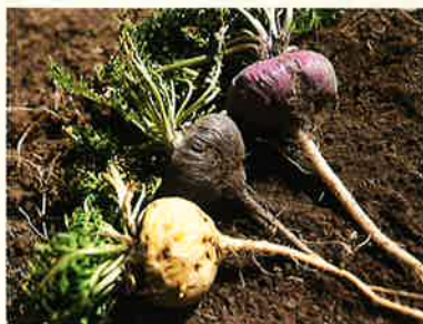
標高4000mの高地で育つ「マカ」