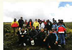
マカ栽培地にて現地の方々と

ヤマノは、安心・安全かつ高品質の天然素材にこだわり、安心してお召上がり頂けるサプリメントをご提供し続けることをお約束します。