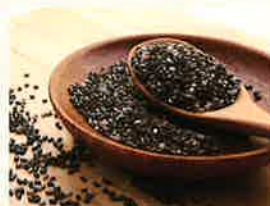
チアシード由来のオメガ3