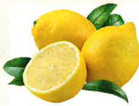
レモン由来の葉酸