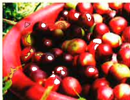
カムカム由来のビタミンC

天然素材にこだわることは、簡単なことではありませんが、これからも皆様の大切な方にもお召上がりいただけるような商品づくりを続けてまいります。