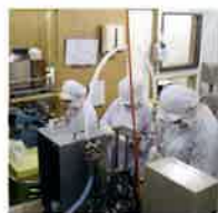
ピストン式クリーム充填機