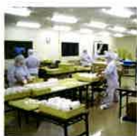
クリーンブース (液体充填ライン)