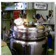
150リットル真空乳化釜