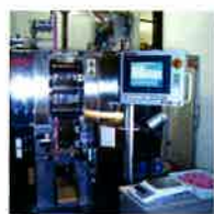
液体三方パウチ (清涼飲料水対応)