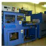
ゼネラルパッカー ラミジップシール機