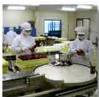
クリーンブース (液体充填ライン)