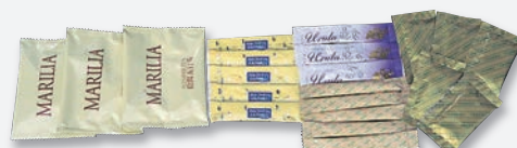
横ピロ袋・スティック分包・三方シール分包