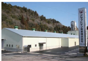
可児工場／原料製造・製剤化