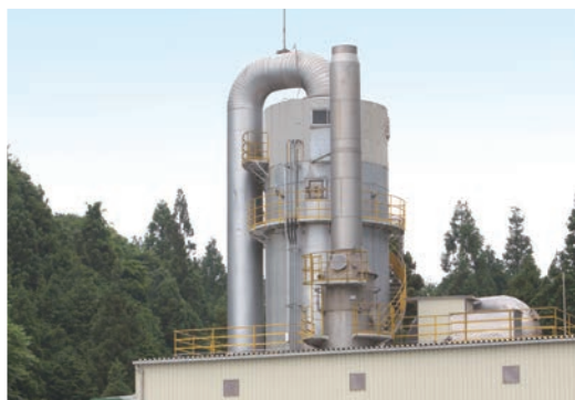
▲日本最大級のスプレードライヤー (蒸発量 850L/h)