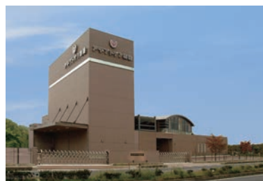
多治見工場／包装・配送