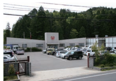
恵那工場／化粧品・医薬部外品・ペット サプリ製造