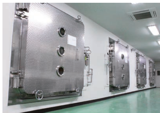
▲超高性能フリーズドライヤー (22㎡×4基)

豊富な原料加工実績から蓄積されたノウハウと充実した設備で、低コスト・高品質を可能にします。天然物は季節、原産地、気候などにより同じ条件で抽出などの作業を行っても原料のロット差により色調や性状、回収率が異なることがあります。その差をなくすためには、検査機器による数値の管理と、技術者の経験に基づく勘が必要なのです。お客様の要望を高いクオリティで叶えるために、日夜挑戦を続けています。