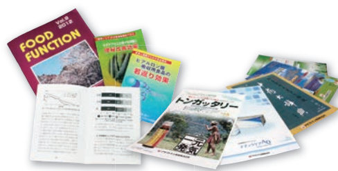
ポップ、パンフレット、チラシ、ポスター